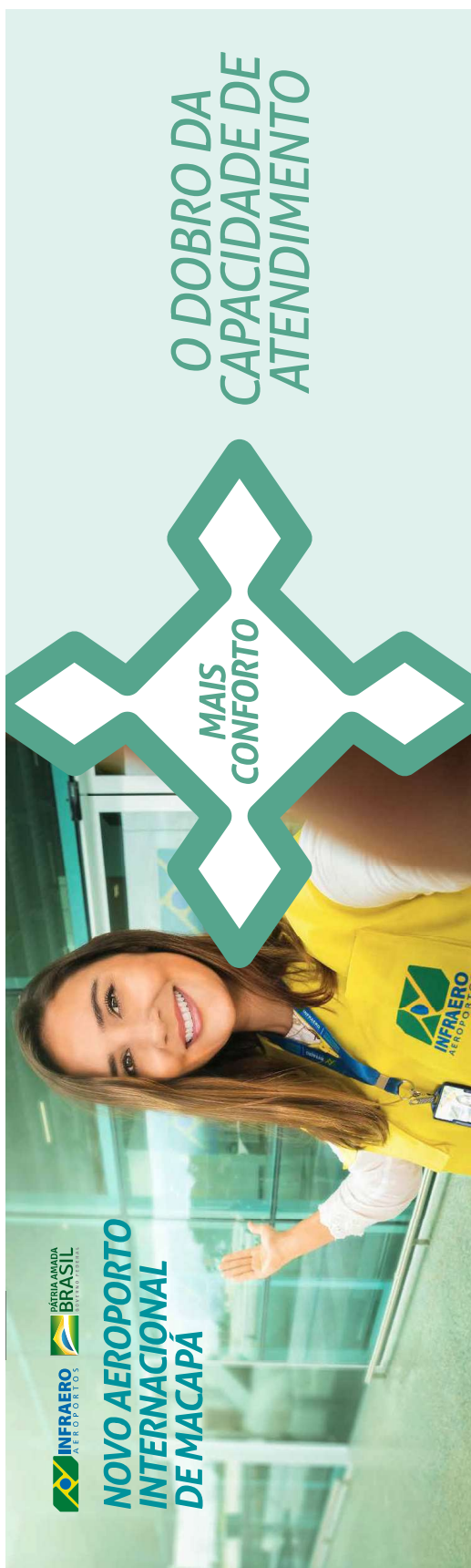
1 - Entrada principal 10 x 3m