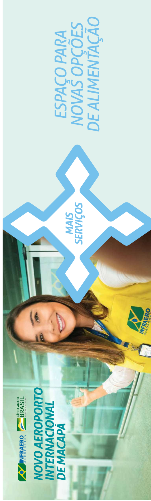
4 - painel praça de alimentação: 9 x 2,7 m