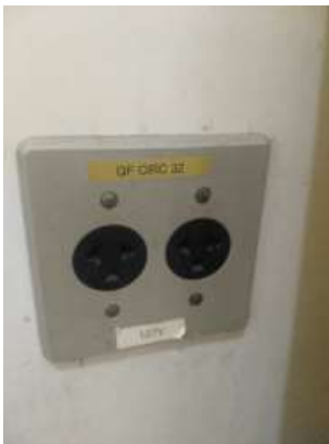
Figura 04: Tomada disponível no local (127V – QF CIRC. 32)