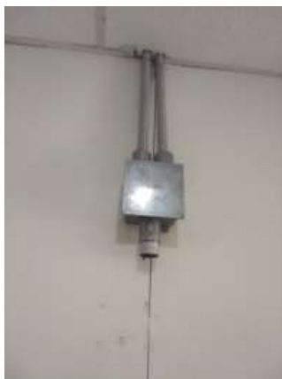
Figura 06: Infraestrutura disponível no local (eletrodutos)