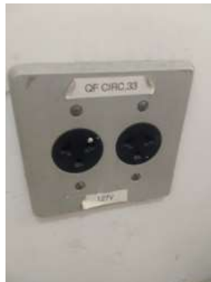
Figura 05: Tomada disponível no local (127V – QF CIRC. 33)