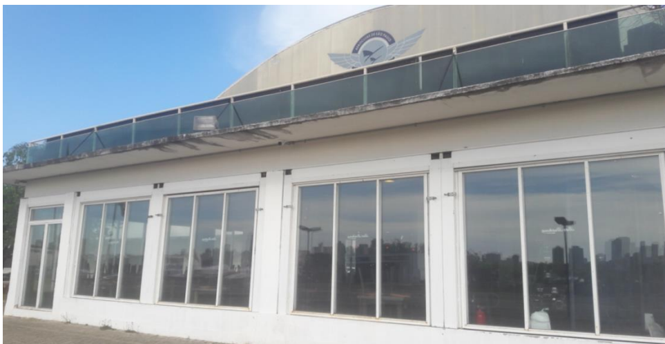
VISTA LADO AR - PARTE