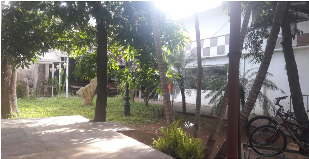
VISTA LADO TERRA - PARTE