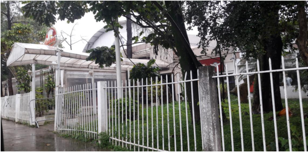
VISTA LADO TERRA - PARTE