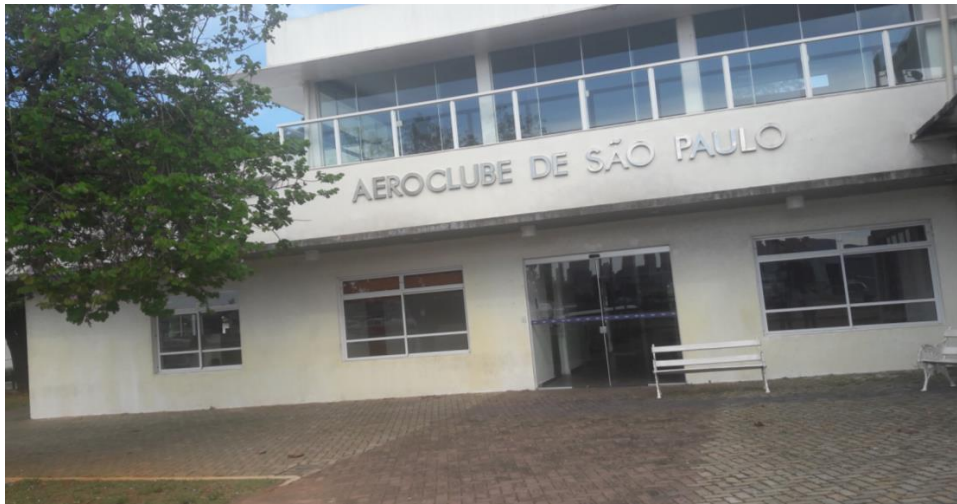
VISTA LADO AR - PARTE