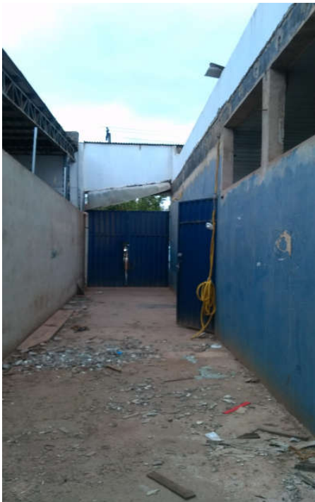
Imagem 04: corredor 01 com 2,70 m