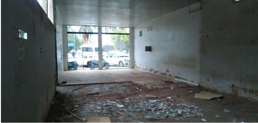
Imagem 02: Sala de 80 m 2