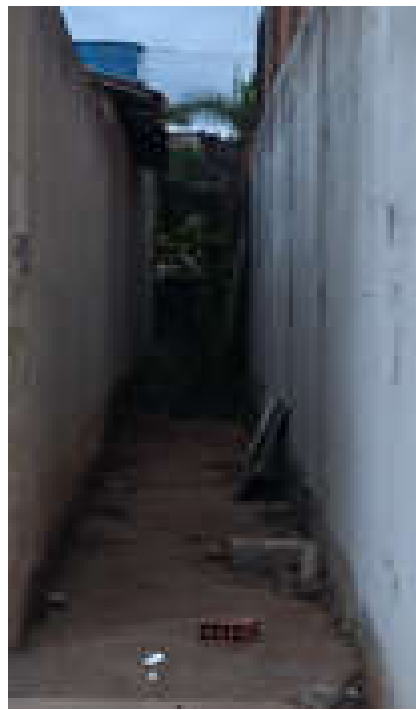
Imagem 05: corredor 02 com 1 m