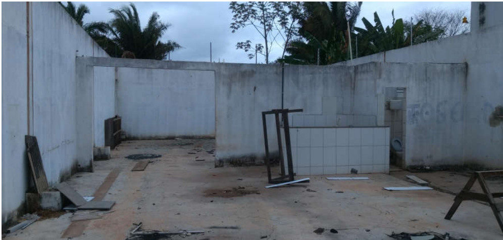
Imagem 06: 400 m 2 , aos fundos, edificado sem cobertura.