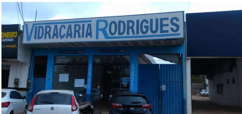
Imagem 01: Fachada

Trata-se de uma área delimitada por muros em alvenaria, com uma loja construída em alvenaria com dimensões de 6 m de frente por 20 metros de lateral.