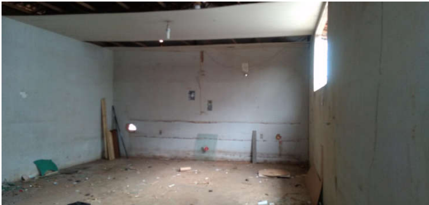
Imagem 03: sala de 40 m 2