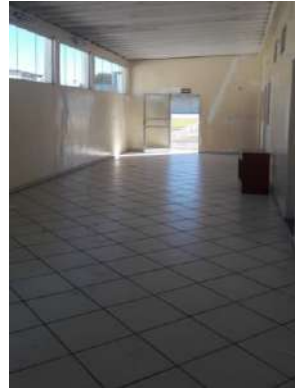
Pisos das áreas administrativas/apoio

S N A área a ser concedida já possui acabamento nas paredes?