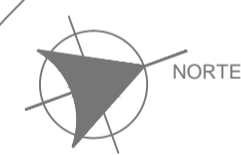
PLANTA BAIXA - 1º PAVIMENTO