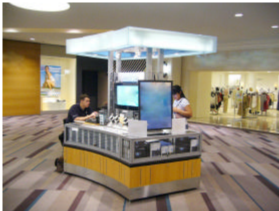
EXEMPLO DE QUIOSQUE-ESTANDE COM USO ADEQUADO DE LETREIRO E VITRINES, PRESERVANDO A LEVEZA E A TRANSPARÊNCIA

f) Elementos aéreos como vitrines e mostruários poderão ocupar no máximo de 50% (cinquenta por cento) da área total da ocupação com mobiliário (quadro acima – item a) do quiosque-estande.