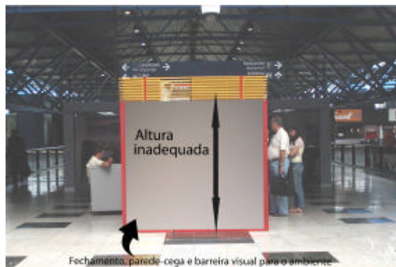
EXEMPLO DE QUIOSQUE-LOJA IMPLANTADO INADEQUADAMENTE (a localização no meio do ambiente configurou barreira visual)

d) A ocupação máxima do letreiro, da identificação visual e dos demais elementos aéreos (vitrines, mostruário etc), em projeção (área efetivamente ocupada), deve corresponder a 20% (vinte por cento) da área máxima de ocupação da concessão, limitada a 3 m (três metros) lineares, em planta baixa.