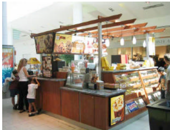
EXEMPLO DE QUIOSQUE COM USO ADEQUADO DE LETREIRO EM APENAS UMA FACE.

d) A ocupação máxima do letreiro, a identificação visual e os demais elementos aéreos (vitrines, mostruário etc), em projeção (área efetivamente ocupada), deve corresponder a 20% (vinte por cento) da área máxima de ocupação da concessão, limitada a 3 m (três metros) lineares, em planta baixa.