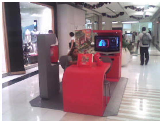
EXEMPLO DE AÇÃO PROMOCIONAL (uso de elementos soltos e balcão para atendimento)

Pode apresentar tipologia física de quiosque-ilha, quiosque-estande ou elementos soltos, com ou sem mobiliário tipo balcão para atendimento.