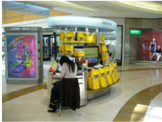
EXEMPLO DE QUIOSQUE-ESTANDE

1.1.3. QUIOSQUE-ESTANDE: concessão com uso de mobiliário tipo balcão e vitrines para exposição de produtos, sem fechamento lateral, com atendimento externo, podendo apresentar elementos aéreos de identificação visual ou fechamento superior. Este modelo geralmente é empregado em feiras.