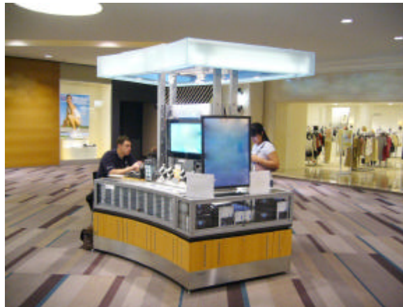
EXEMPLO DE QUIOSQUE-ESTANDE