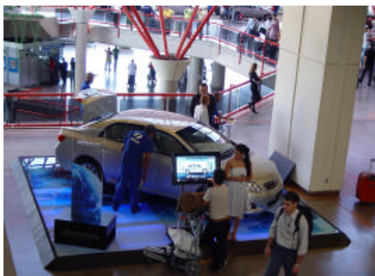
EXEMPLO DE AÇÃO PROMOCIONAL (uso de produto solto)