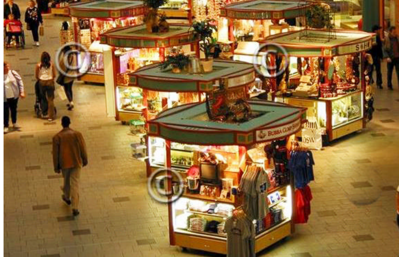
EXEMPLO DE FEIRA (uso de quiosque-estande padronizado)

Tipo de concessão eventual, em espaço único e reservado para vários expositores de produtos e serviços. Pode apresentar tipologia única, padronizada ou variada de quiosque-estande ou quiosque-ilha.