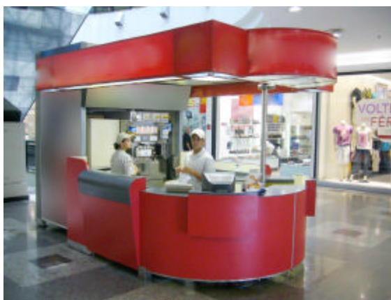
EXEMPLO DE QUIOSQUE-LOJA (uso de fechamentos lateral e superior)

1.1.2. QUIOSQUE-LOJA: modelo de concessão com emprego de mobiliário, estilo balcão ou similar, com atendimento interno, podendo apresentar fechamentos lateral e superior. De modo exclusivo, é instalado junto de paredes-cegas ou vedações.