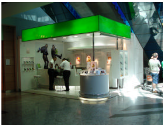
EXEMPLOS DE QUIOSQUE-LOJA (uso de fechamentos lateral e superior)