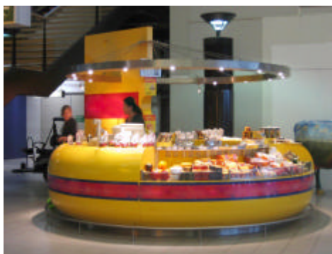
EXEMPLO DE QUIOSQUE-ILHA