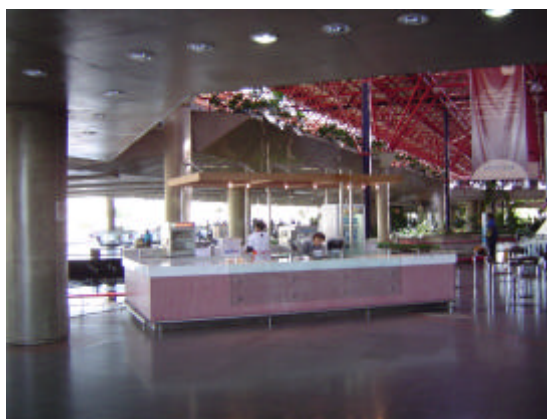
EXEMPLO DE EXCEÇÃO DE QUIOSQUE-ILHA (uso de fechamento lateral em vidro incolor, transparente e sem adesivagem)

c) não serão permitidos fechamentos lateral e superior, exceto fechamento lateral em vidro incolor, transparente e sem adesivagem, com altura máxima de 2,50 m (dois metros e cinquenta centímetros).