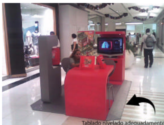
EXEMPLO DE QUIOSQUE COM DESNÍVEL ADEQUADO, (nivelado ao piso do saguão com uso de rampa)