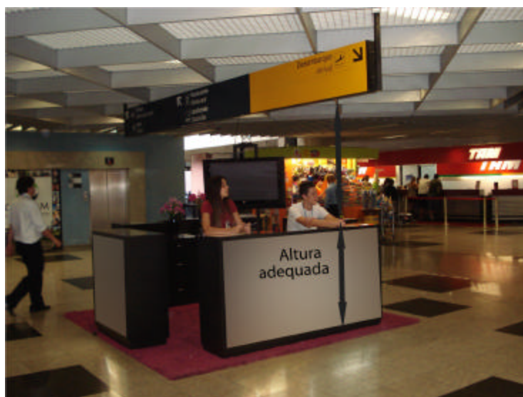
EXEMPLO DE QUIOSQUE COM ALTURA ADEQUADA E SEM PREJUÍZO À SINALIZAÇÃO DO TERMINAL

b) altura máxima permitida do balcão é de 1,20 m (um metro e vinte centímetros). Essa metragem preserva a visibilidade do ambiente circundante e o sentido de localização e orientação do passageiro no TPS. Neste caso, é necessário prever rebaixo especial para atendimento ao consumidor com deficiência ou com mobilidade reduzida.