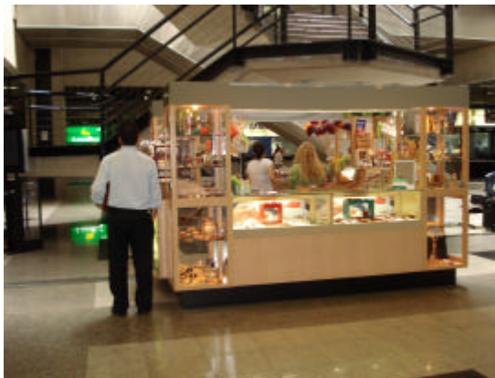
EXEMPLO DE QUIOSQUE COM USO INADEQUADO DE LETREIRO E VITRINES, CONFIGURANDO-SE BARREIRA VISUAL PARA O AMBIENTE

e) A altura máxima de coroamento da identificação visual e dos demais elementos aéreos é de 2,50 m (dois metros e cinquenta centímetros), desde que não interfira no STVV (Sistema de TV e Vigilância), o que deve ser verificado com a área de Segurança do aeroporto.