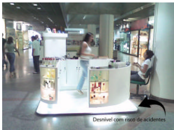
EXEMPLO DE QUIOSQUE COM DESNÍVEL INADEQUADO, OCACIONANDO RISCO DE ACIDENTE.

b) Os quiosques devem ser totalmente apoiados no chão. Não são admitidas brechas entre base e piso, uma vez que essas aberturas são foco para o acúmulo de sujeira e insetos, além de não contribuírem funcional ou esteticamente para a instalação. A alternativa de uso de tablados e tapetes não é recomendada pois desvaloriza a apresentação visual do ponto e configura-se risco de acidente.