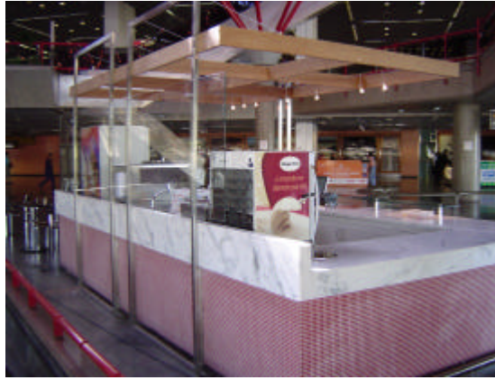
EXEMPLO DE EXCESSÃO DE QUIOSQUE-ILHA (uso de fechamento lateral em vidro incolor, transparente e sem adesivagem)

d) A ocupação máxima do letreiro, a identificação visual e os demais elementos aéreos (vitrines, mostruário etc), em projeção (área efetivamente ocupada), deve corresponder a 20% (vinte por cento) da área máxima de ocupação da concessão, limitada a 3 m (três metros) lineares, em planta baixa.