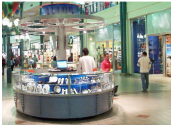
EXEMPLO DE QUIOSQUE COM ALTURA ADEQUADA, GARANTINDO VISIBILIDADE PARA AS LOJAS DO FUNDO

c) não serão permitidos fechamentos lateral e superior, exceto fechamento lateral em vidro incolor, transparente e sem adesivagem, com altura máxima de 2,50 m (dois metros e cinquenta centímetros).