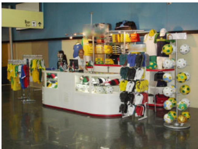
EXEMPLOS DE QUIOSQUES COM EXPOSIÇÃO INADEQUADA DE PRODUTOS (produtos fora do limite estabelecido)

a) Conforme determina o item “a” de cada tipo de quiosque, os produtos expostos não podem ultrapassar os limites do quiosque.