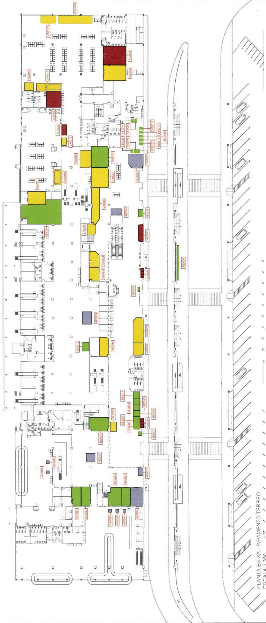
PLANTA BAIXA - PAVIMENTO TERREO ESCALA 1:350