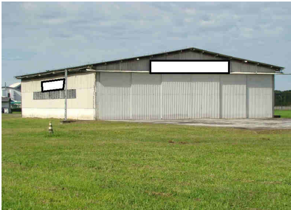
Foto 03 - Fachada Noroeste do Hangar e pátio externo