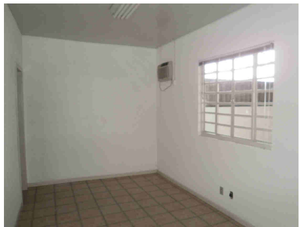
Foto 01 - Escritório de apoio interno