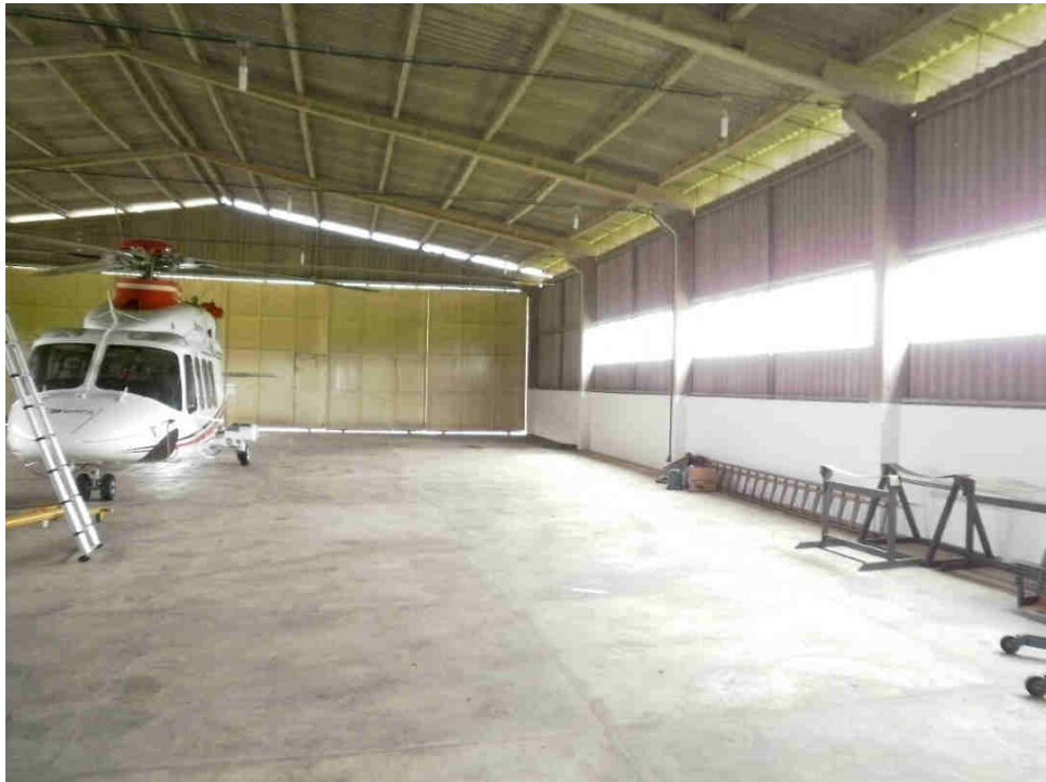
Foto 04 - Área interna do Hangar