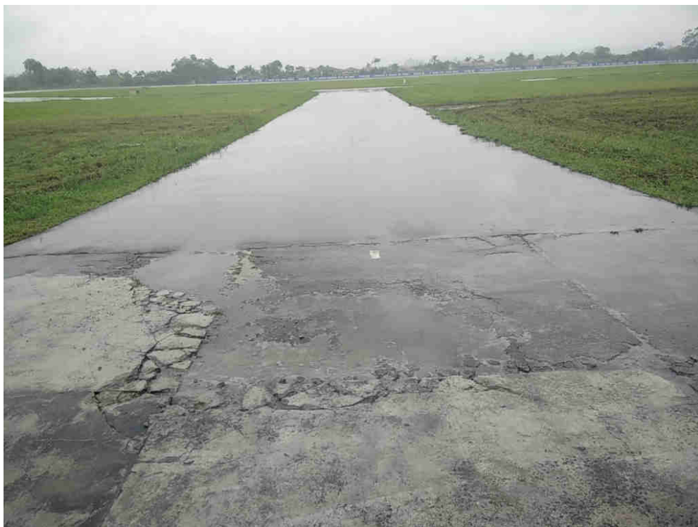
Foto 05 - Acesso à TAXI A