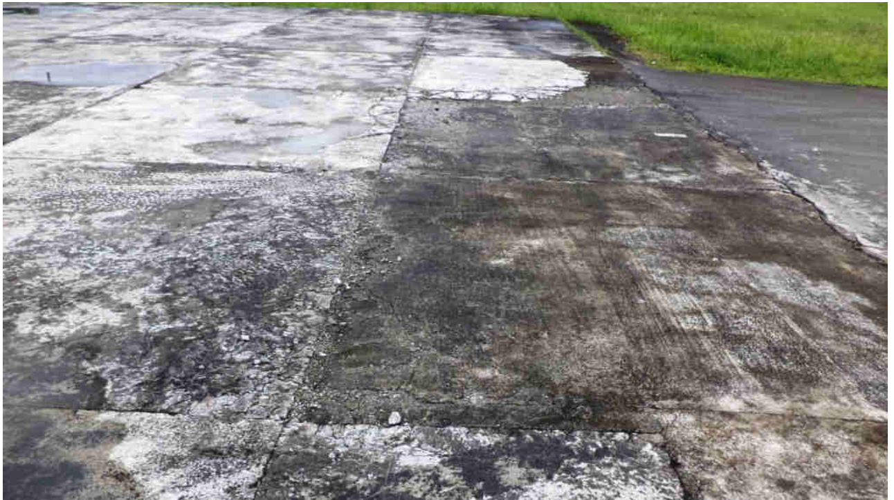
Foto 06 - Pátio externo