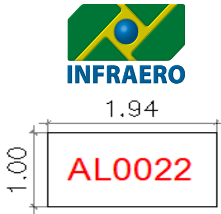
Figura 02: Detalhe da Área Da Máquina para venda de refrigerantes, salgados e/ou sucos.