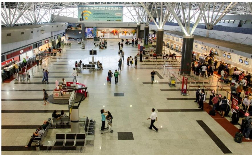
Balcões de Check-in e Totens de Autoatendimento