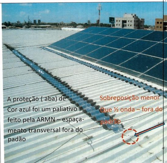
A proteção (aba) de Cor azul foi um paliativo feito pela ARMN – espaçamento transversal fora do padrão