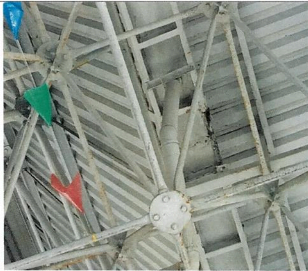
Alto grau de corrosão em calha da cobertura do TPS III.