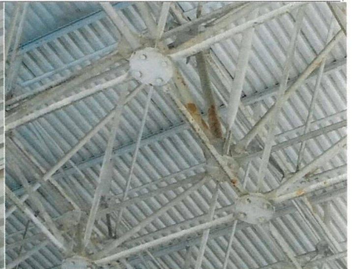
Alto grau de corrosão da estrutura metálica do TPS III.