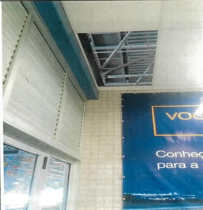
O forro em gesso acartonado da recepção da Infraero não suportou o acúmulo de água proveniente de goteira e cedeu.