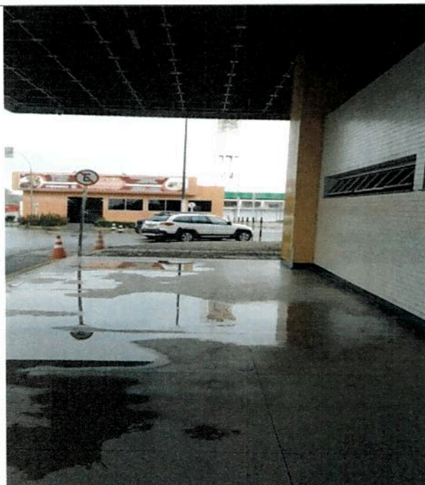
Passeio do TPS III – conexão da calha encontra-se danificada provocando alagamento

A estrutura espacial do Terminal de Passageiros I onde estão alocados alguns órgãos, (DTCEA, Delegacia da Polícia Federal, Petrobrás), apesar de instalada há mais de 20 anos não apresenta oxidação por ser em alumínio. O telhado do TPS I recebeu tratamento de impermeabilização contratado pelo DTCEA, anteriormente às obras de 2013, e não havia nenhum registro de goteiras. No entanto, após as obras de reforma da cobertura, recebemos alguns relatos do problema em período de chuva. Documento da Polícia Federal em anexo.