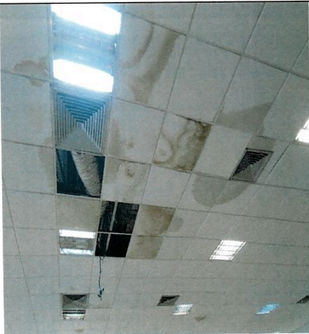
Forros em gesso acartonado da Praça de Alimentação não suportam a grande quantidade de água e caem deixando tubos de ar condicionado expostos e provocando a fuga do ar frio.